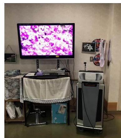
DK エルダーシステム

また、外部講師を招いた活動もあり、普段との変化もあります。無理なく・楽しく・自由な発想をモットーにプログラム作りをしています。